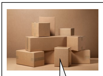
テキストボックス (枠線)

*写真は文中に貼り付けてください。jpg で用意する必要があるときは、別途ご連絡致します。